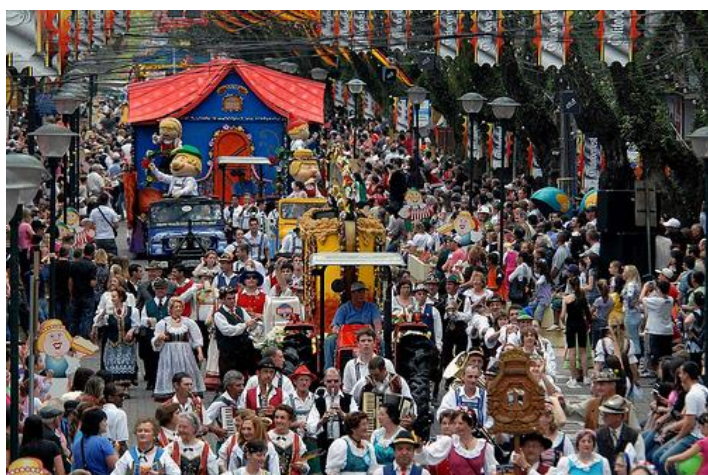
Desfile da Oktoberfest pelo centro da cidade.

Acesse: http://www.oktoberfestsantacruz.com.br/