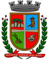
PREFEITURA MUNICIPAL DE SANTA CRUZ DO SUL